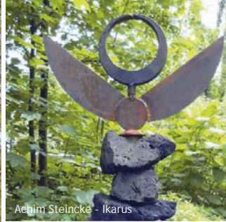
Achim Steincke - Ikarus