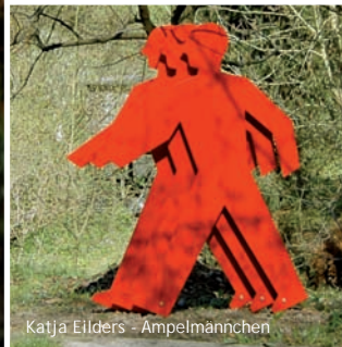
Katja Eilders - Ampelmännchen