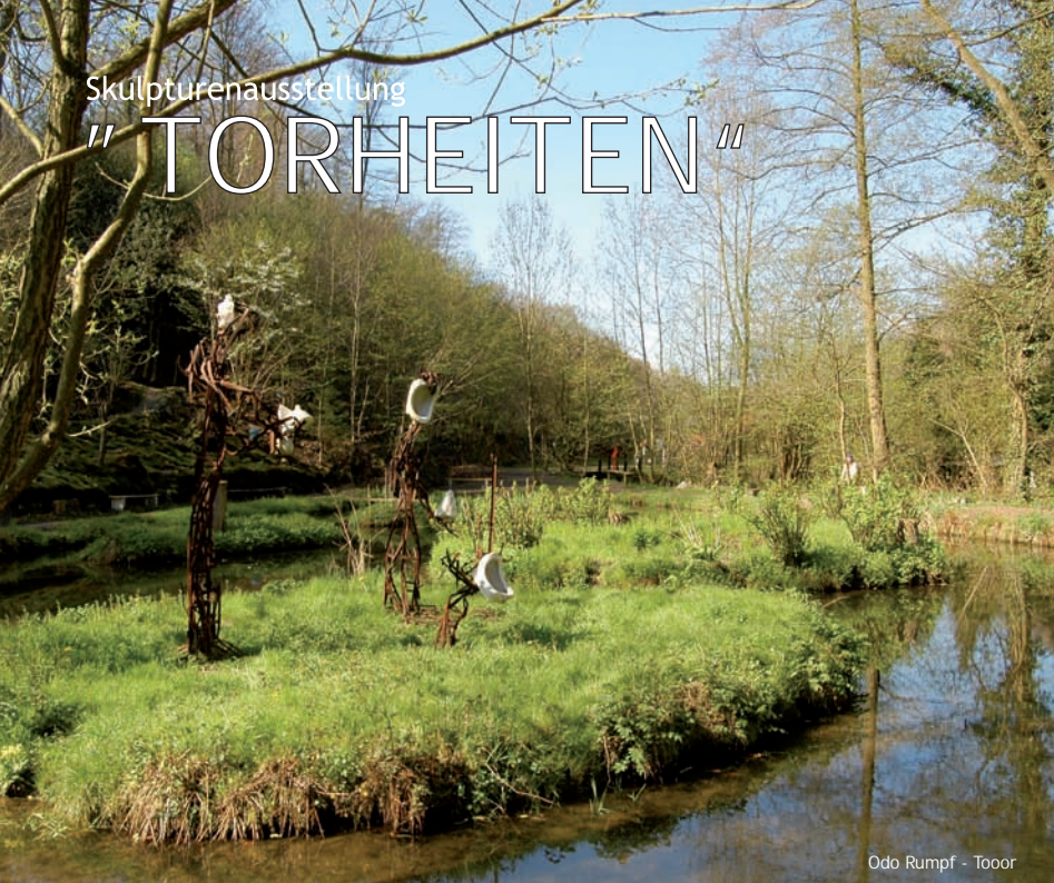
Odo Rumpf - Tooor